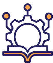
FIG. 01: Niveles de actuación

Las propuestas se estructuran en cuatro niveles de actuación y, a su vez, en seis ejes específicos. En total, se articulan 33 propuestas, que se detallan a continuación.