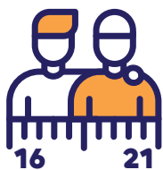
FIG. 02: Ejes

EJE 1. Cobertura de la franja 16-21 años