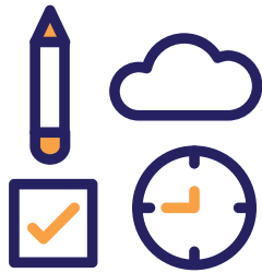
FIG. 03: Esquema de las propuestas