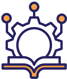
FIG. 03: Esquema de las propuestas